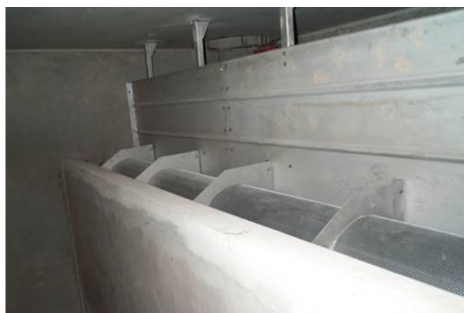
Detalle de la reja autolimpiante