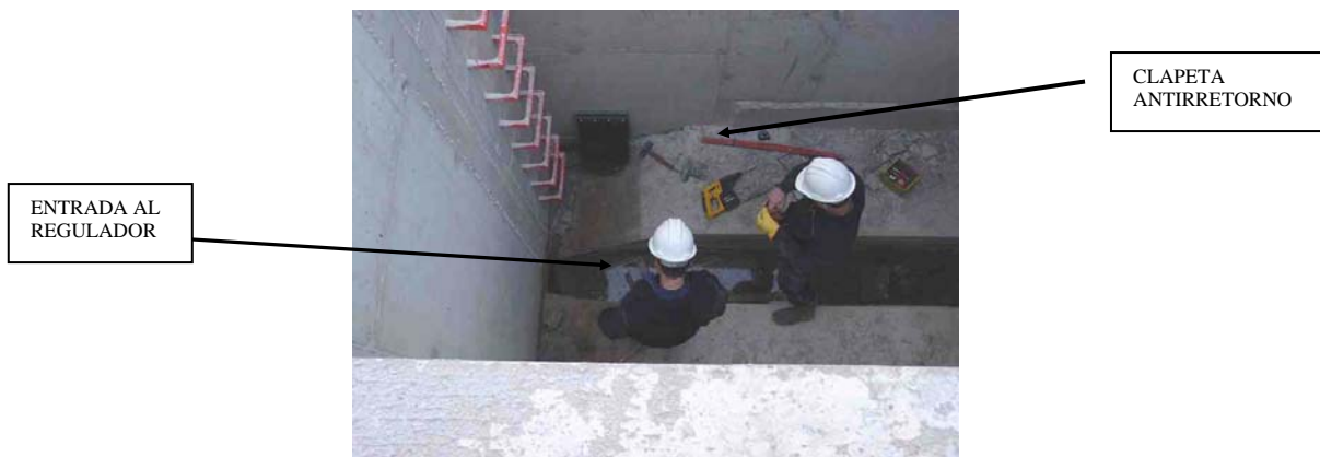
Detalle cámara central en la entrada al regulador

También en este canal y hacia la cámara de alivio se coloca una placa deflectora de flotantes que evita la salida de los flotantes al medio receptor. En la actualidad, a la pantalla deflectora se le añade una reja autolimpiante (tamiz) para evitar que se viertan por el muro de alivio sólidos (flotantes) de un tamaño superior a los 5-6 mm de longitud.