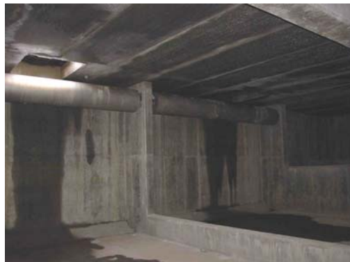
Detalle tanque retención con dos limpiadores

La solera de esta cámara de retención en su parte de mayor cota dispone de una cuna donde se recibe la ola generada por el limpiador de la manera mas suave posible, el radio de esta cuna depende de la capacidad del elemento de limpieza y cuyo dimensionamiento, accionamiento y funcionamiento se explicarán en sucesivos puntos.