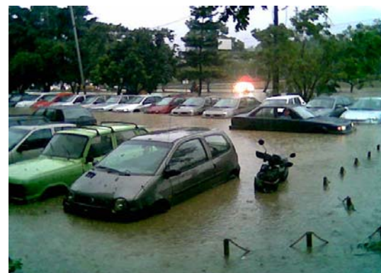
Inundaciones producidas por la incapacidad de absorber los picos máximos de lluvias por los sistemas convencionales