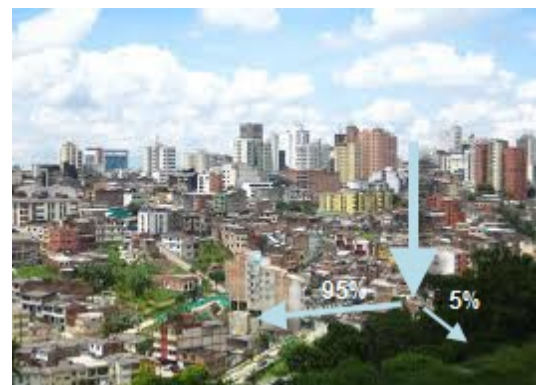
Escorrentía en medio urbano

Durante años la práctica habitual del drenaje urbano ha sido trasladar el agua mediante tubos rápidamente fuera de la ciudad. Los cauces urbanos han sido canalizados y el alcantarillado diseñado para captar y conducir toda el agua de escorrentía superficial. Debido a esta práctica, los ríos han perdido su riqueza natural y su capacidad de respuesta ante las crecidas, mientras que los colectores pluviales se han visto incapaces de absorber la cantidad de agua adicional procedente de las zonas con nuevos desarrollos urbanos.