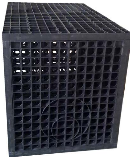
Detalle del Hidrobox 1.1 (*)

El sistema Hidrobox conforma una geoestructura plástica de alta resistencia que permite ejecutar elementos de captación pluvial, acumulación y transporte subterráneo de forma modular y sencilla. Con un montaje manual muy simple, el producto admite diversas configuraciones en función de la resistencia exigida.