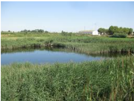
Estanques de retención

La calidad paisajística que ofrecen estos sistemas es de un nivel muy alto. Una población con sistemas de drenaje sostenible puede pasear junto a un arroyo tranquilo en vez de una cuneta de hormigón, puede ver desde su casa una laguna llena de vida en vez de un solar inundado. Estos sistemas permiten convertir toda la ciudad en un parque, ofreciendo un refugio a la flora y fauna autóctonas, y evitando así su desaparición del medio urbano. Ofrecen un gran servicio a la comunidad: economía, paisaje y naturaleza.